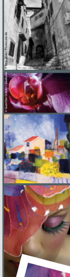
Foto und FineArt Profile Package